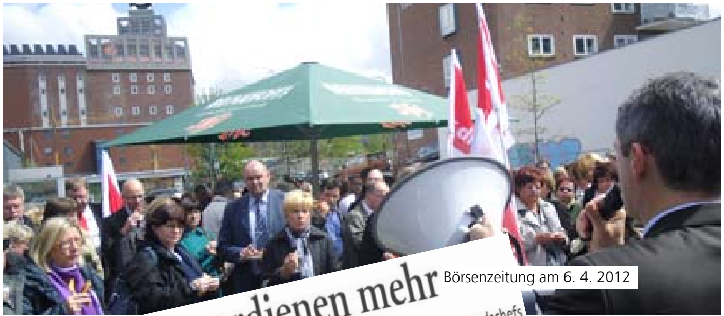
Börsenzeitung am 6. 4. 2012

Warnstreiks vor und nach der dritten Verhandlungsrunde. Die Dortmunder begannen am 24. April (oben), am 27. April folgten die Berliner (Mitte), als auch in Baden-Württemberg die Bausparkassen und viele andere streikten - zusammen über 2.000. Der erste Warnstreik in Braunschweig (unten) fand am 10. Mai statt. Am Tage drauf folgte Hannover mit einem Tagesstreik. Weitere sind angekündigt.