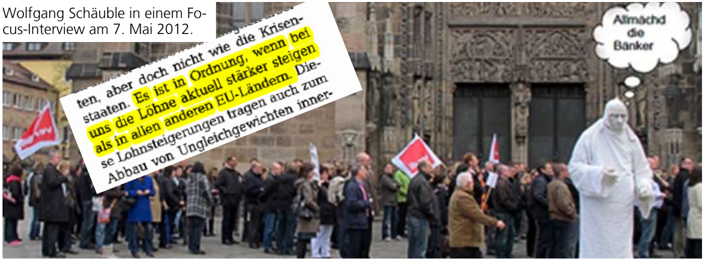
Wolfgang Schäuble in einem Focus-Interview am 7. Mai 2012.

Schließlich ein paar Beispiele für die vielfältigen Proteste und Aktionen bundesweit im Saarland, Bremen, Leipzig, Hannover usw. hier einige Highlights: am 20. April vor dem Gemäuer einer ehrwürdigen Nürnberger Kirche; am 27. April die Banker-Tafel an der Hamburger Alster und noch einmal das Pfeifkonzert am 30. April in München.